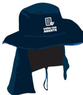
parte de trás do chapéu

A aplicação da identificação do Programa Saúde com Agente deverá ser feita utilizando a versão negativo, cor branca ou azul, conforme ilustração ao lado.