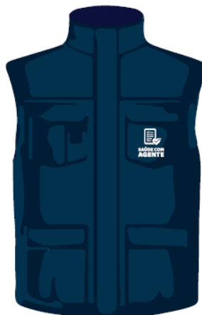
parte da frente