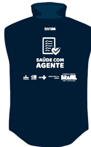
parte de trás